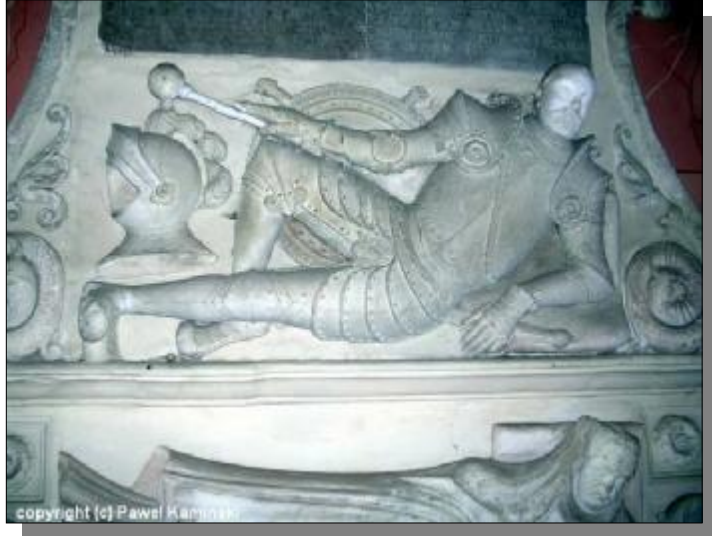
Nagrobek Sancygniowskich autorstwa Santi Gucciego