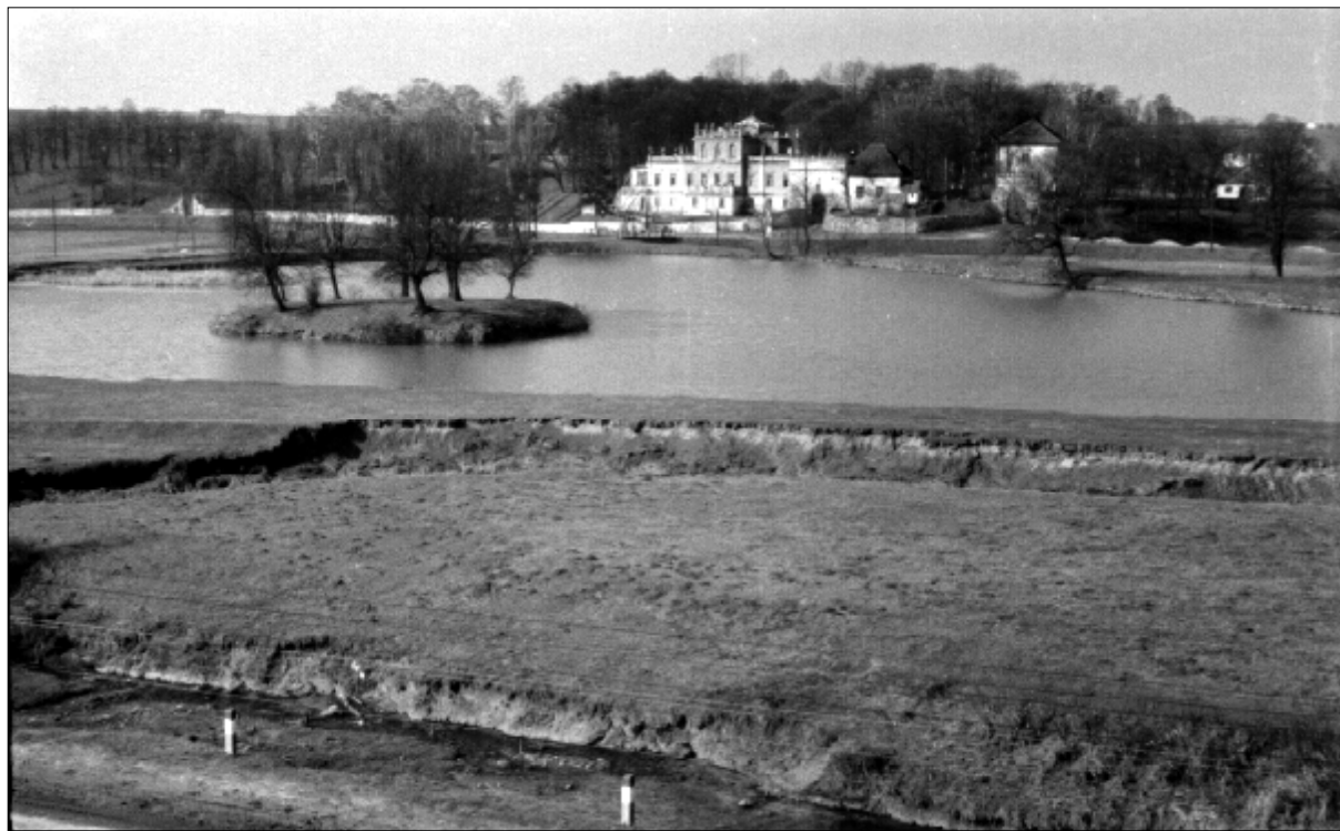
Dawny widok Sancygniowa