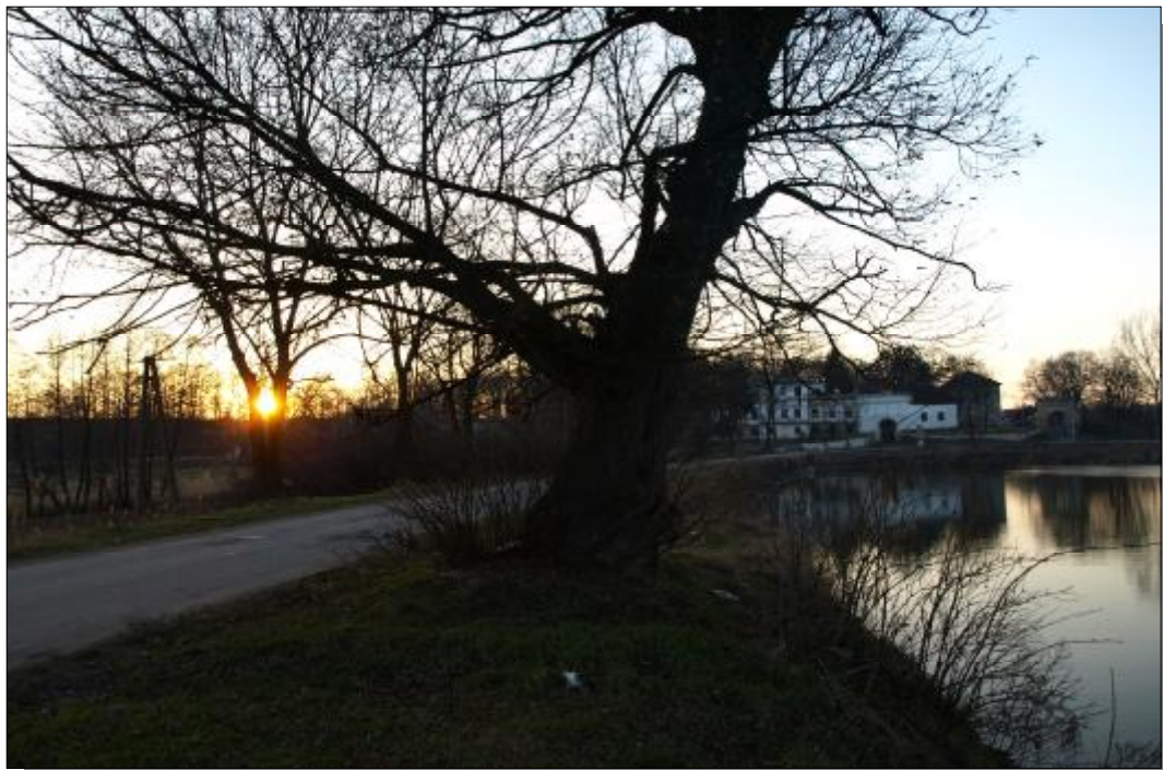
Widok na pałac Deskurów