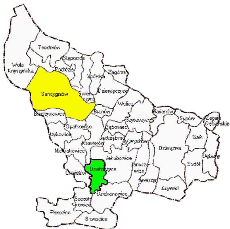
Mapa gminy Działoszyce z sołectwem Sancygniów